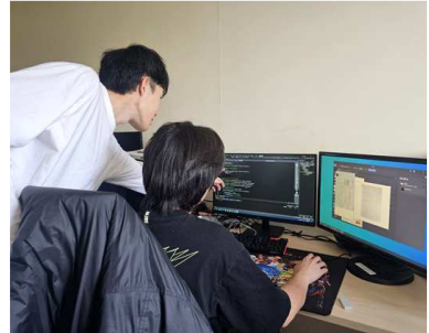
첨단 AI 모델 연구