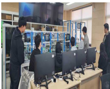
HMI 프로그램 실습