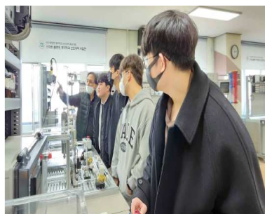
PLC 공정제어 실습