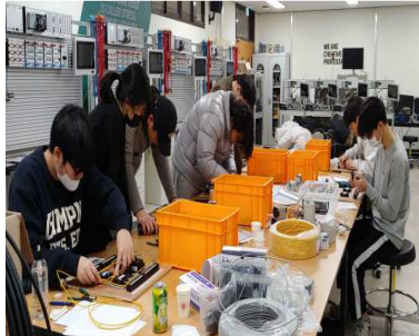
배선·배관 실습 ①