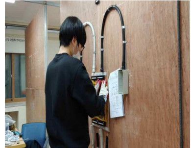
배선·배관 실습 ②