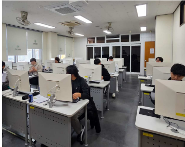
디지털 실무 교육