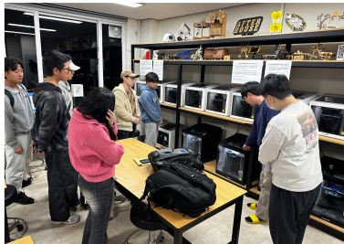
3D 프린팅 출력