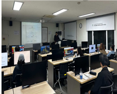
영상 콘텐츠 제작