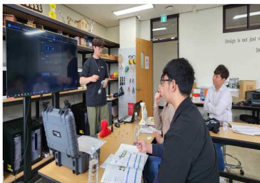
3D 스캔 및 역설계