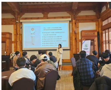
전문가 초청 특강