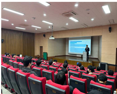
비즈니스 리더십 교육